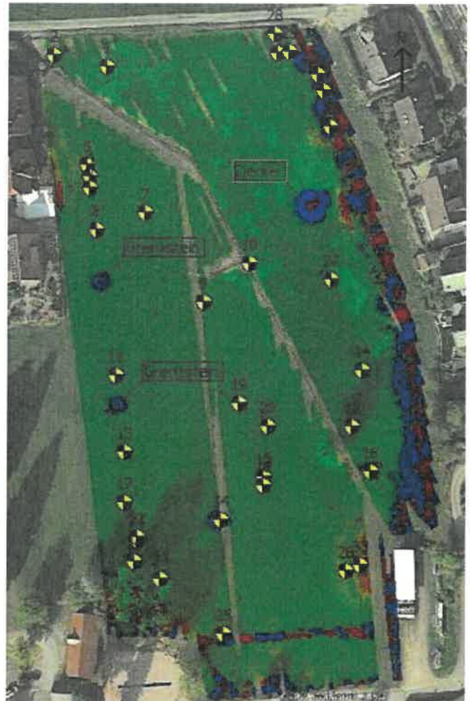
OG-4358 Farbkarte mit Anomalien